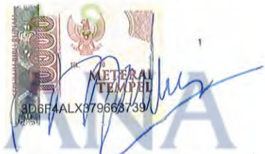
Firda Balqis Intan Palupi