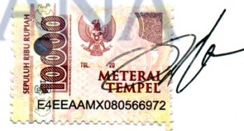
Intan Ayu Wulandari