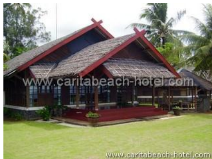
Gambar 3.1 Fasad Bangunan Mutiara Carita Cottages