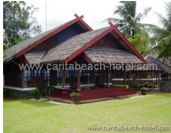
Gambar 3.1 Mutiara Carita Cottages