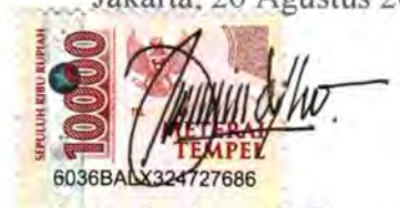
Reginaldus Elfridus Lobo