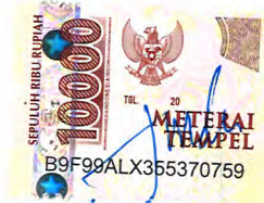
Mei Ike Nurlinda