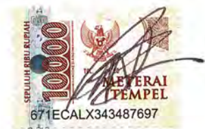
Ibnu Bagas Abhinaya