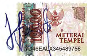
Putri Komala Dewi