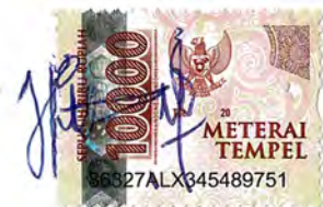
Putri Komala Dewi