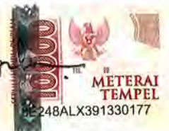
Peto Syamsul Alam