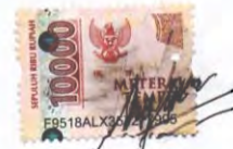
Diaz Ilyasa Dwiputra