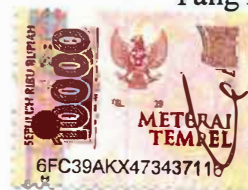
Vania Tara Saraswati