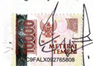
Tegar Bayu Prasetyo