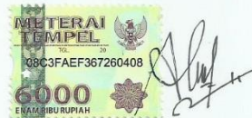
Aldena Aini Fitria