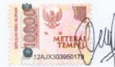
Al Mahdi Akbar