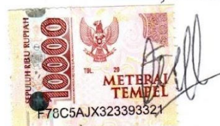
Fadlilah Achmad Falevi