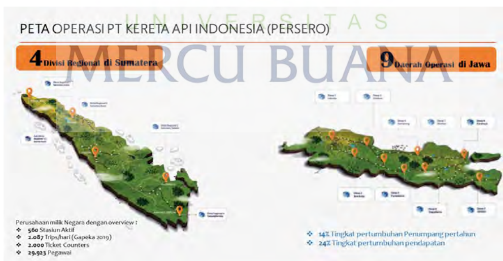
Gambar 1. Peta Operasi PT Kereta Api Indonesia

Transportasi Kereta Api saat ini sangat membantu mobilitas masyarakat Indonesia, khususnya di pulau Jawa dan Sumatra. Dari data yang diambil melalui PT KAI Persero, menunjukkan bahwa pertumbuhan penumpang Kereta Api sampai dengan November 2019 sudah mengalami peningkatan sampai 14% pertahun, dengan jumlah pertumbuhan pendapatan yang juga meningkat sampai 24% [1].