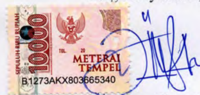
Tegar Boy Albaresi

Jakarta, 03 Februari 2024 Yang menyatakan,