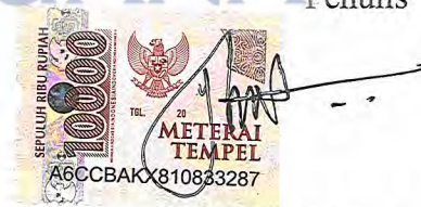
Yoku Al Riqza