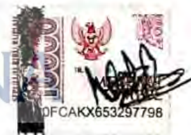
Nabila Nurshafira Putrimanto