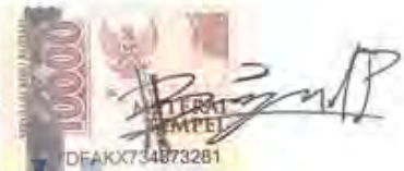
Bagaskara Nur Pradana.