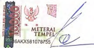
Anggoro Sasmito MB