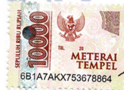
Ade Intan Lestari