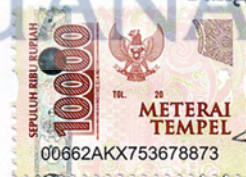
Ade Intan Lestari

Jakarta, 2 September 2023 Yang menyatakan,