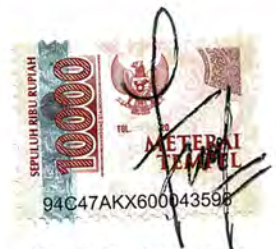
Fitri Dwi Lestari