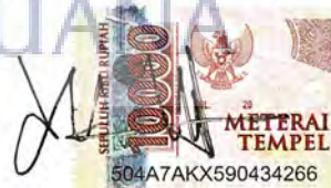
Dimas Yulianto Saputra

Jakarta, 1 September 2023 UNIVERSITAS MERCU BUANA