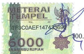
I Made Sudiadnya