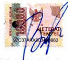
Bella Oktisa Helmi Nasution