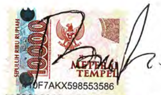
Bella Oktisa Helmi Nasution