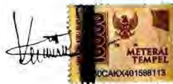
Vebri Syukur Laia