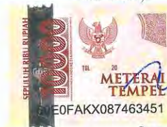
Imam Aziz Wijayanto