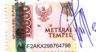
Chindy Elita Sitanggung