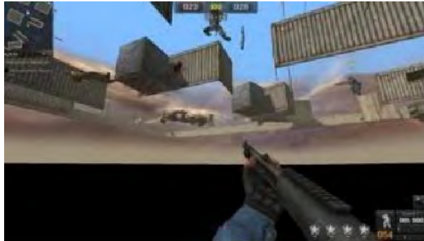
Gambar 4.7 Bug

Bug adalah error dalam sistem permainan game online point blank (PB) . Bug merupakan suatu kejadian dimana pemain dapat masuk ke dalam dinding atau benda dan dengan mudah dapat membunuh pemain yang lainnya.