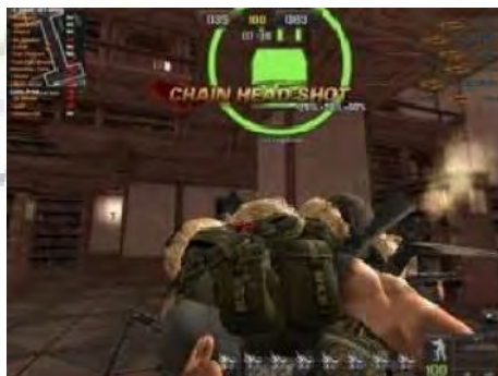
Gambar 4.16 Magned

Cheat magned merupakan cheat yang membuat semua pemain berkumpul dalam satu titik di tengah map, dan tidak bisa bergerak. Hanya pemain yang menggunakan cheat magned -lah yang dapat bergerak sesuka hati.