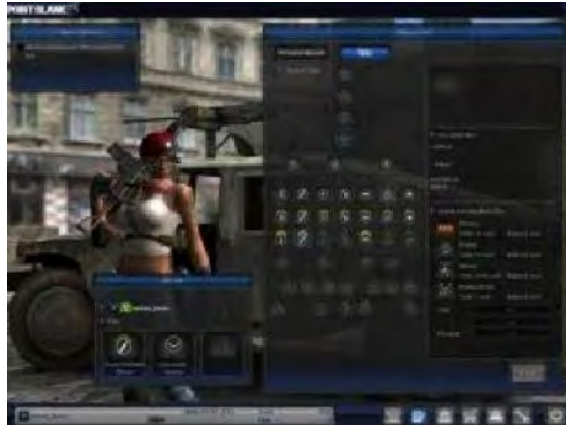
Gambar 4.11 Hack Baret

Fungsi cheat ini adalah untuk membuka semua Baret yang ada. Tetapi cheat ini hanya bisa digunakan oleh pemain yang berpangkat Mayor.