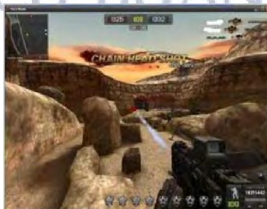
Gambar 4.5 Auto HeadShot (AIMBOT atau AIM+++)