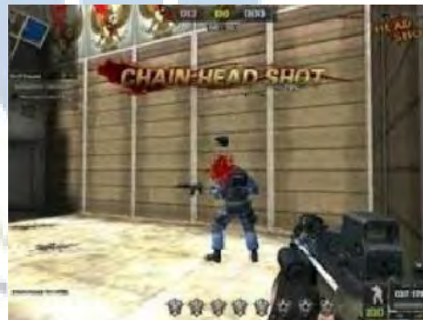
Gambar 4.14 Hilang Raga

Cheat ini merupakan cheat yang sangat bagus tetapi tidak sempurna. Cheat ini dapat membuat cheater PB menghilang dan dapat muncul di tempat yang diinginkan. Tetapi kelemahan cheat ini adalah tubuh pemain PB tidak hilang di tempat pertama kali berada. Jadi pemain dengan mudah membunuh pemain yang lainnya.