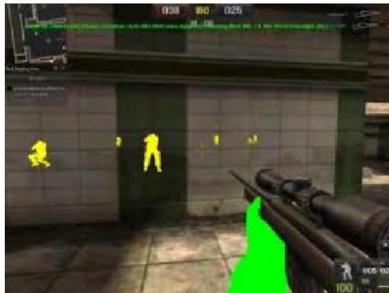
Gambar 4.2 Wall Hack

Wall hack dalam game online point blank (PB) sering disebut juga dengan WH. Cheat ini membuat pemain yang menggunakannya dapat melihat pemain lain yang terhalang oleh tembok atau dinding. Dengan begitu dapat memudahkan seorang pemain untuk melakukan kecurangan dengan menembak pemain yang lain dan tanpa takut akan ditembak dari belakang oleh lawan.