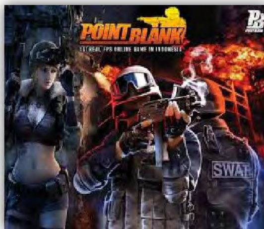
Gambar 4.1 Logo Game Online Point Blank (PB)