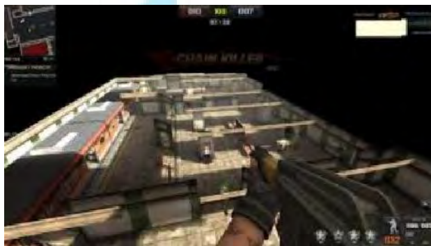
Gambar 4.6 Gravitasi

Gravitasi merupakan cheat yang hampir sama dengan cheat wall shot . Yang membedakannya adalah di dalam wall shot , pemain masih berada dalam area pertarungan. Sedangkan dalam cheat gravitasi dapat membuat pemain berpindah ke atas area pertarungan (seperti terbang).