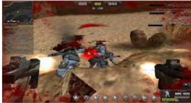
Gambar 4.9 Unlimited Ammo (Peluru Tak Terbatas)

Unlimited ammo merupakan cheat yang hampir sama dengan cheat bomberman . Namun yang membedakannya adalah medianya. Jika bomberman medianya menggunakan bom, sedangkan cheat unlimited ammo medianya menggunakan amunisi atau peluru.