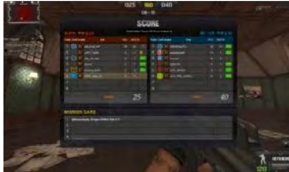
Gambar 4.13 Hack Pangkat

Cheat ini dapat dengan mudahnya menaikkan pangkat pemain PB dalam hitungan menit.