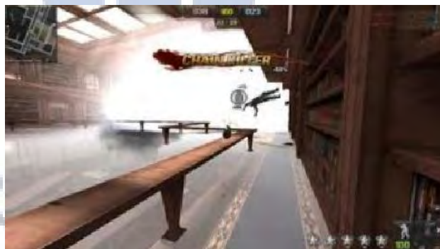
Gambar 4.8 Bomberman

Bomberman merupakan cheat yang membuat pemain tidak dapat melempar bom tanpa batas. Namun cheat tersebut dapat sekali membuat pemain DC ( disconnect ) atau terputus dari permainan. Sehingga pemain yang terkena DC ( disconnect ) akan merasa marah dan kesal.