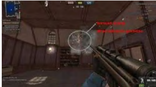
Gambar 4.15 Brust

Brust merupakan cheat yang cocok untuk para pemain yang suka bermain shotgun . Cheat ini membuat senjata shotgun tidak perlu dikokang. Dengan begitu pemain dapat menembak lawan dengan menggunakan shotgun tanpa harus berhenti sebentar untuk mengokang senjata. Namun cheat Brust juga dapat digunakan untuk senjata sniper .