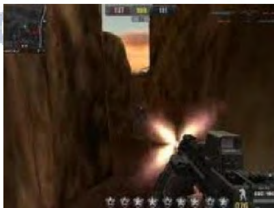
Gambar 4.3 Wall Shot

Wall shot sebenarnya hampir sama dengan wall hack . Namun cheat ini lebih mengerikan dari cheat wall hack . Bagaimana tidak, pemain yang