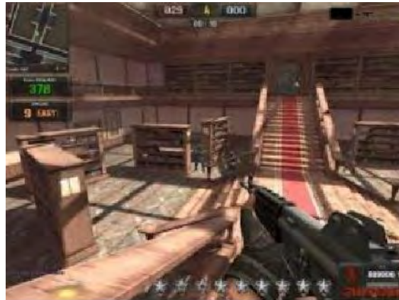
Gambar 4.4 One Hit

Cheat ini merupakan cheat yang sangat membuat para pemain emosi jika dibunuh oleh pemain lain yang menggunakannya. Cheat ini akan menjadi lebih sempurna jika digabungkan dengan wall hack .