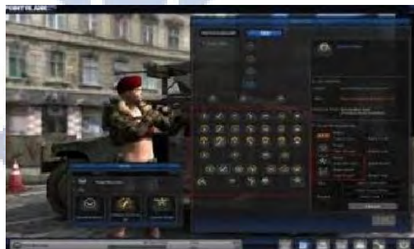
Gambar 4.10 Master Medal

Cheat master medal merupakan cheat yang sangat lama dan jarang yang ada menggunakan cheat ini. Cheat ini membuat pemain dengan mudah mendapatkan master medal yang digunakan untuk menjadi tittle tanpa harus menyelesaikan misi. Dengan cheat ini akan memudahkan pemain untuk melakukan kecurangan dari pemain-pemain lainnya.