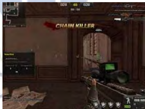
Gambar 4.12 Replace Weapon

Cheat ini dapat membuat seorang pemain dapat menggunakan senjata yang diinginkan tanpa harus mengumpulkan poin-poin untuk bisa mendapatkannya.