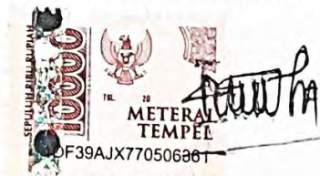
Nabila Nur Aini