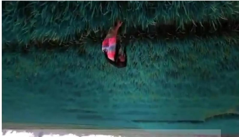
Gambar – adegan Rio berlari di sawah

Pergerakan kamera dalam adegan ini merupakan pergerakan kamera yang memutar dari atas kebawah membuat gambar pada salah satu scene ini berbeda dengan film lainnya, sang sutradara Anggy Umbara, tetap memasukan makna atau simbol simbol dalam pergerakan adegan kamera ini , seperti yang dikatakan Anggy Umbara berikut ini :