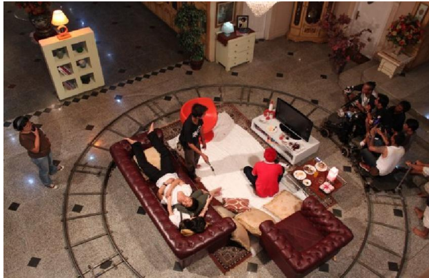
Gambar – Behind The Scene pergerakan kamera mengelilingi pemain

Dalam pergerakan kamera ini, DOP film mamacake Dicky R Maland mengatakan bahwa :