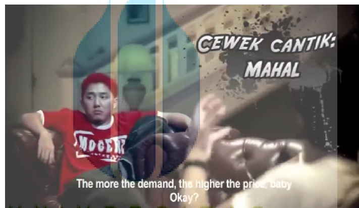
Gambar – Adegan Rakha menceritakan Keluh Kesahnya

Di dalam adegan tersebut, pergerakan kamera ( camera movement ) bergerak 360° mengelilingi semua pemain yang berada dalam ruang ketika sedang berdialog yang menceritakan masalah masalah dalam kehidupannya, dalam teknik pergerakan kamera ini, hampir semua film di Indonesia tidak pernah menggunakan teknik pergerakan tersebut, teknik ini merupakan konsep pergerakan kamera yang ingin meletakkan sebuah makna dalam pergerakan kamera tersebut, berikut penuturan DOP Dicky R Maland :