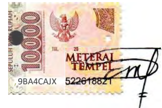
Shinta Dwi Saputri