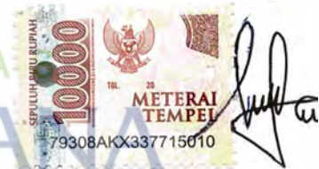
Lika Laila Trivalza