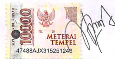
Widi Bayu Nugroho