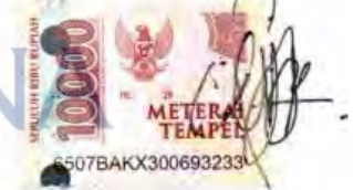
Dimas Bagus Mukhlis