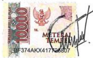
Petrus Paternus Wogo