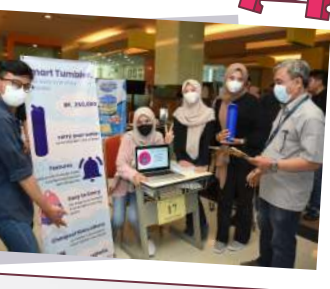
Pameran Perancangan Aplikasi dan Sistem Teknik Industri 3 Desember 2022