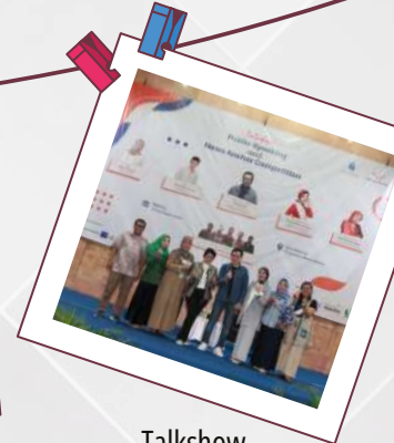
Talkshow Public Speaking and News Anchor Competition 10 Desember 2022