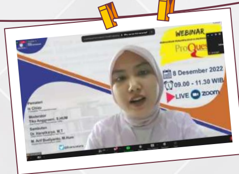
Sosialisasi Pemanfaatan E-Journal dan E-book Pro Request 8 Desember 2022