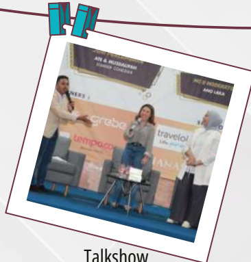
Talkshow Personal Branding in Social Media and Stand Up Comedy Competition 17 Desember 2022