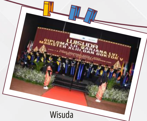
Wisuda Diploma LII, Sarjana LVI, Magister XLIII dan Doktor V 21 Desember 2022