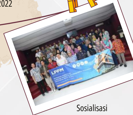
Sosialisasi Kegiatan di LPPM 13 Desember 2022