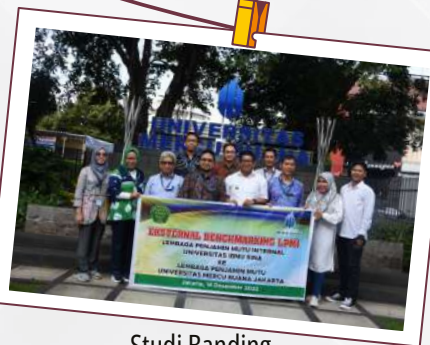
Studi Banding Universitas Ibnu Sina 14 Desember 2022