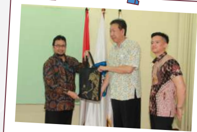
Studi Banding Universitas Multi Data Palembang 14 Desember 2022