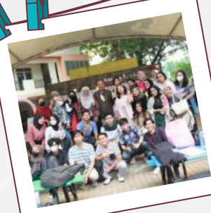
Mercu Beauty Expo 2022 7-9 Desember 2022