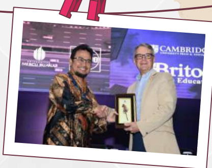
Talkshow Cambridge 6 Desember 2022