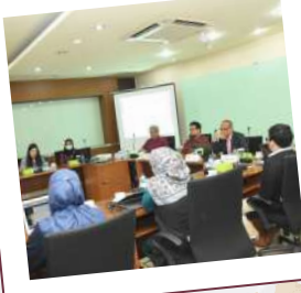
Workshop For Internationalization and Ranking 6 Desember 2022