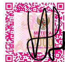
( Niken Dwi Astuti)