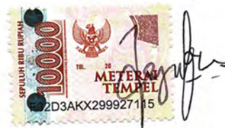
Fitria Nurul Syahidah