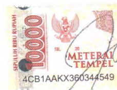
Nurul Ayu Prajuanita