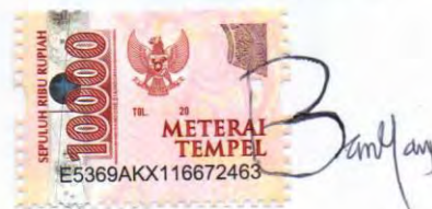
Bambang Adi Priyono