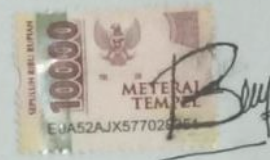
Bella Ridwanti Ariasa