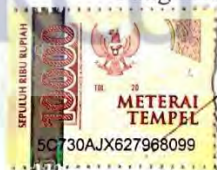
(Mega Siska Aryanti)

Jakarta, 14 Januari 2022 Yang membuat Pernyataan,