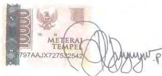
Ari Dwi Yoga Prasetyo