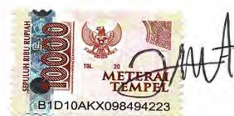
Diah Ayu Pitaloka