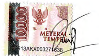
Anggita Jati Anggraini