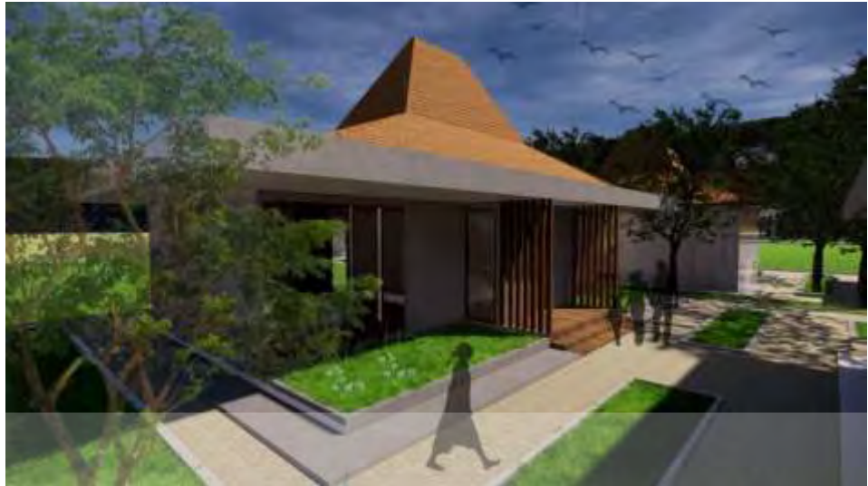
Gambar 5.9 Homestay VVIP