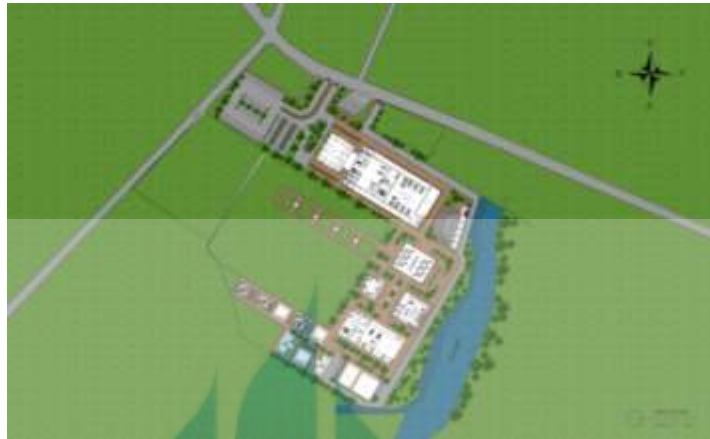
Gambar 5.1 Siteplan