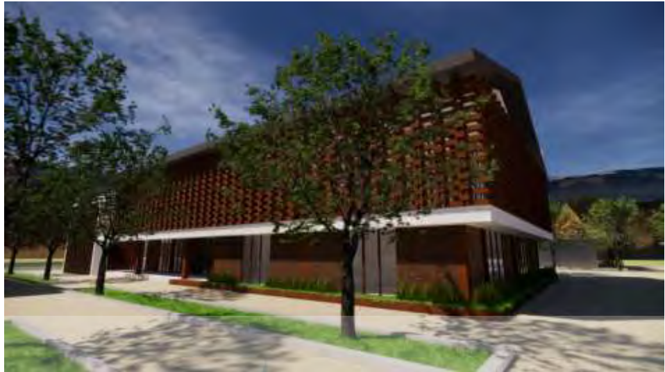
Gambar 5.7 Kantor UPT, Workshop, dan Perpustakaan