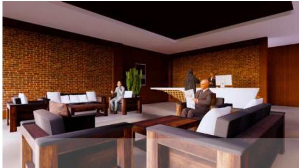
Gambar 5.11 Kantor UPT