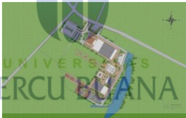
Gambar 5.2 Blokplan