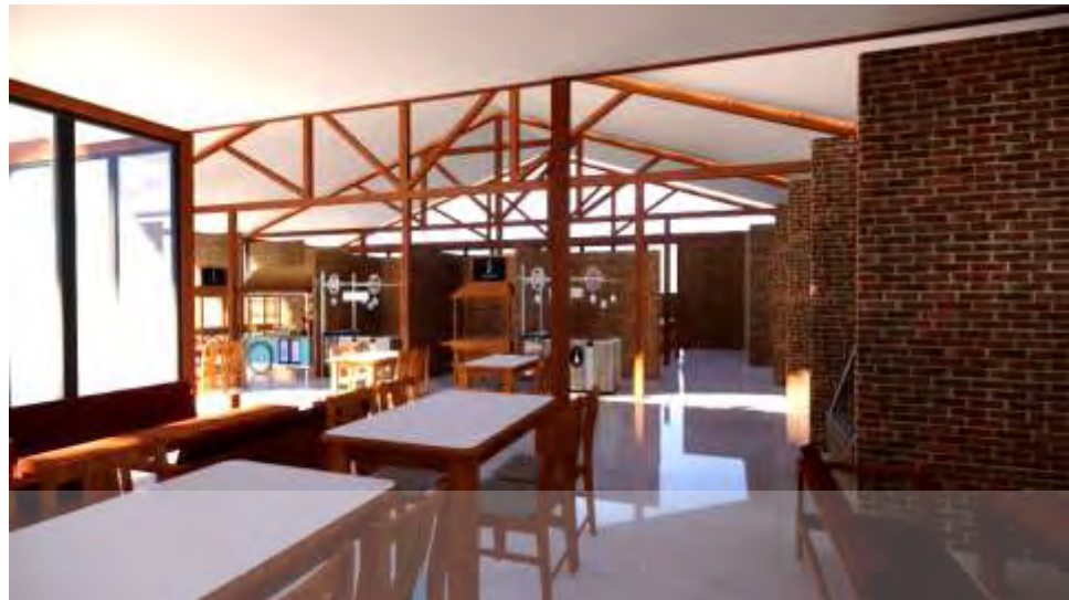
Gambar 5.13 Foodcourt