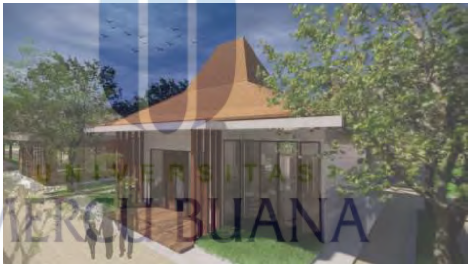
Gambar 5.8 Homestay VIP (Sumber : Data Pribadi)