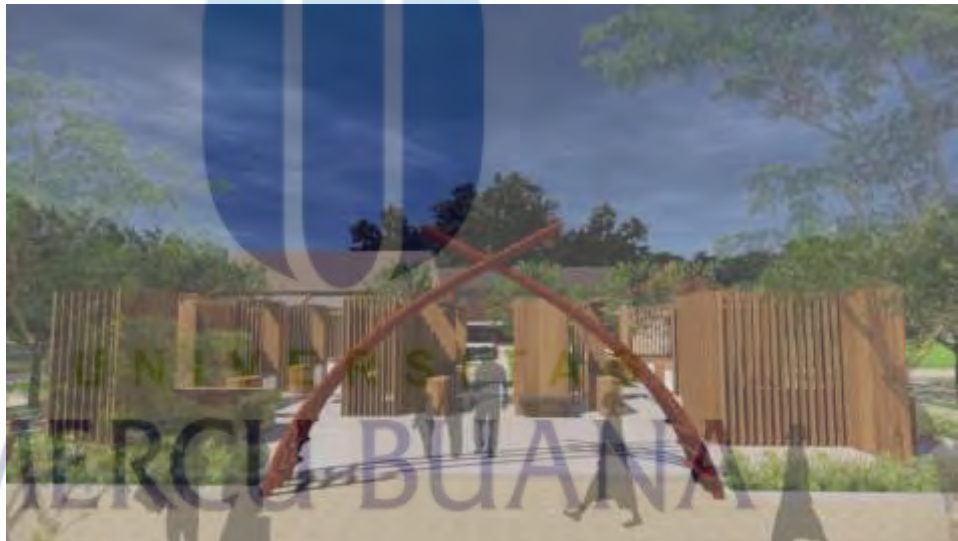
Gambar 5.6 Pameran Terbuka