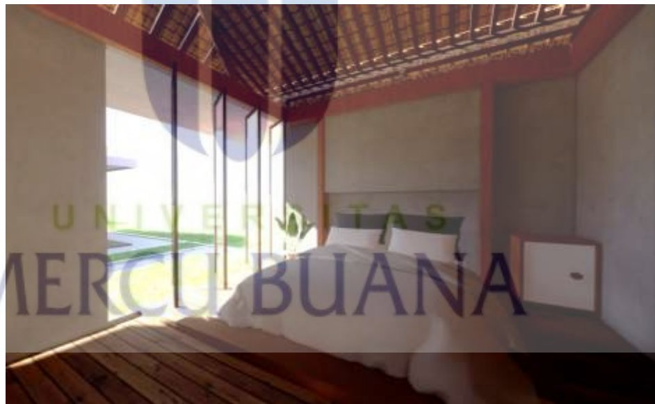
Gambar 5.14 Homestay