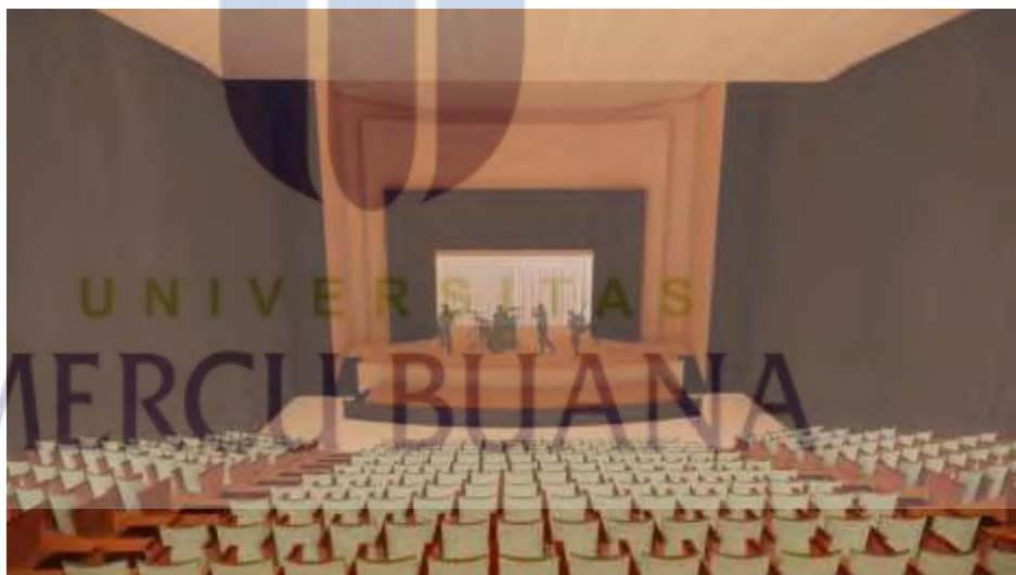
Gambar 5.10 Auditorium