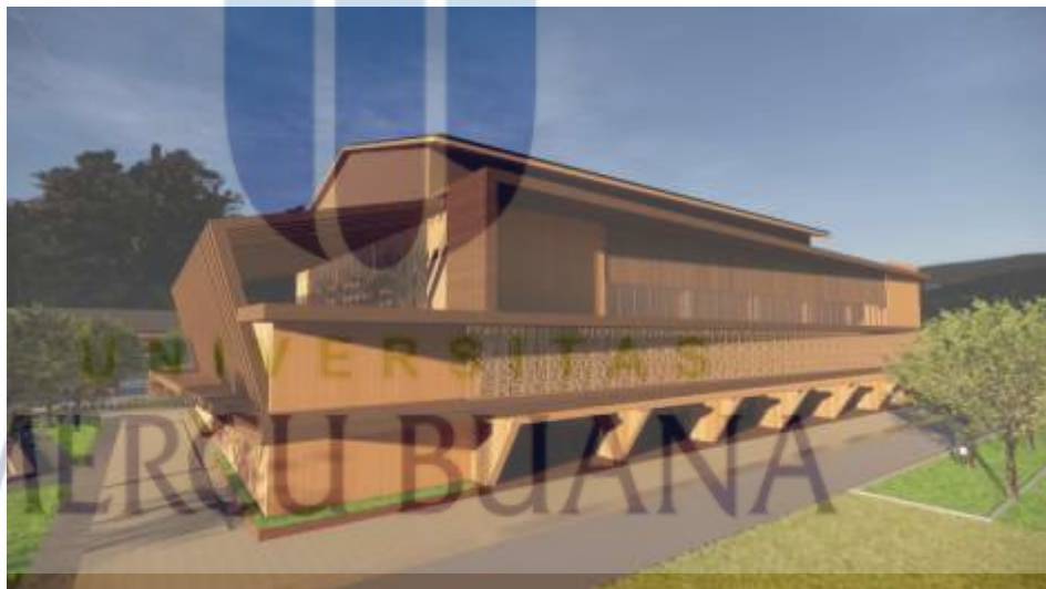
Gambar 5.4 Gedung Serbaguna