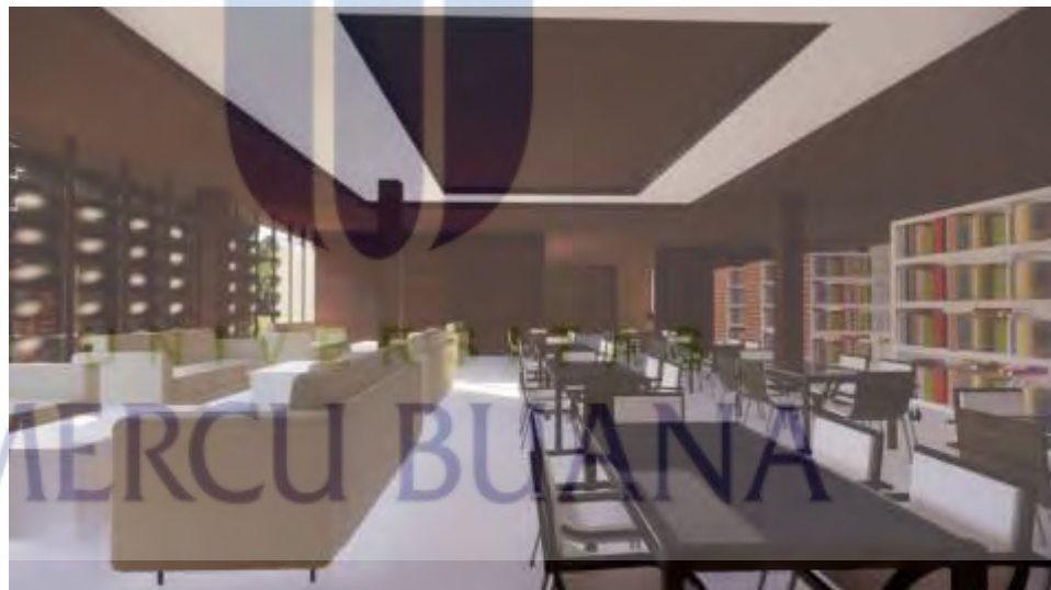
Gambar 5.12 Perpustakaan