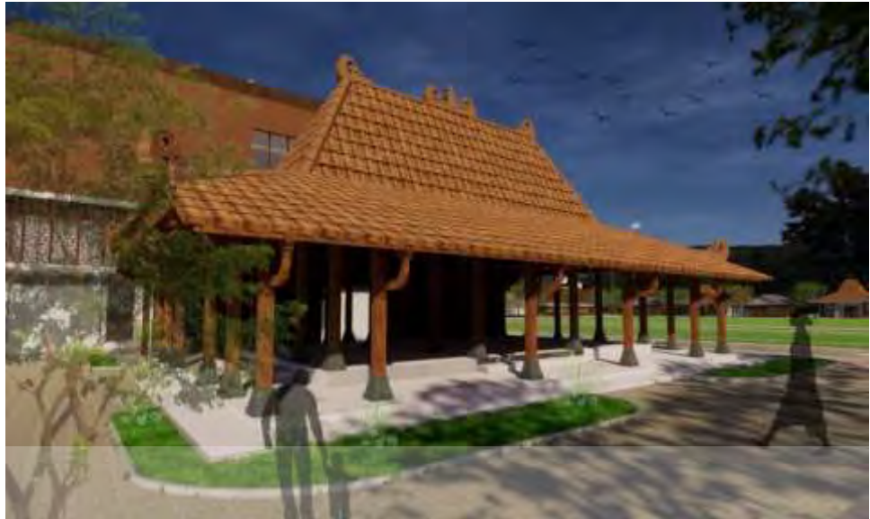
Gambar 5.5 Joglo Pendopo