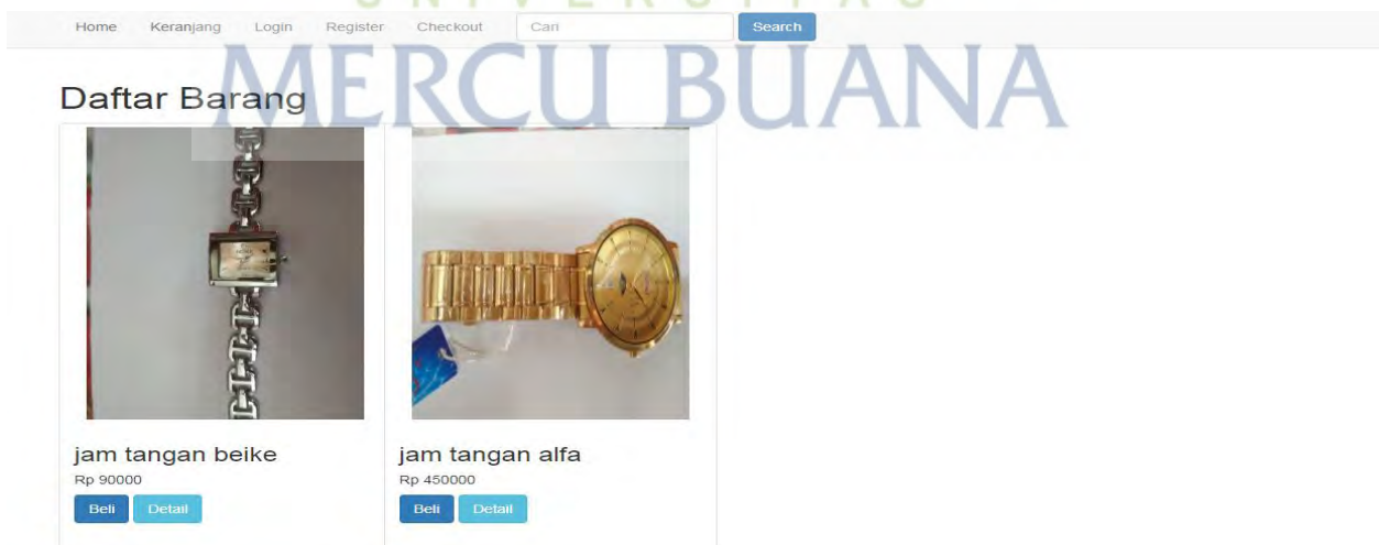
Gambar 19. Hasil Pencarian

Gambar diatas merupakan pattern atau kata kunci yang di ketikkan oleh pelanggan untuk mencari barang yang diinginkan oleh pelanggan dengan contoh kata kunci tangan seperti gambar di atas.