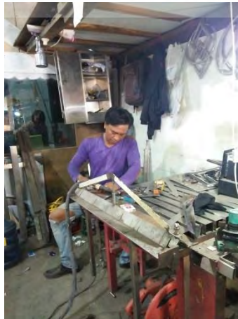
Gambar 72. Proses Pembuatan di Workshop Anugrah Stainless Steel

Penanggung Jawab : Bapak Deni dan Bapak Kasim Lim Alamat : Rukan bandengan Indah Blok B No. 1 Penjaringan, Jakarta Utara, Jakarta, Indonesia 14440 Spesialis : Pemilik workshop untuk membuat produk Slutee It.