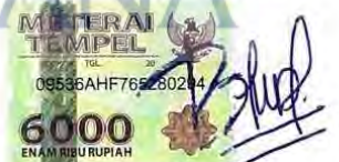
T Bella Sahira